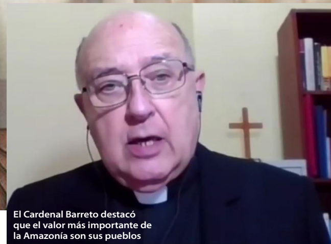
El Cardenal Barreto destacó que el valor más importante de la Amazonía son sus pueblos

Desde el 2013, se han reportado 15 asesinatos a defensores ambientales, de los cuales siete murieron durante la pandemia. Solo en el 2021, tres líderes indígenas han sido asesinados y decenas viven bajo amenaza. IRI Perú solicitó a los ministerios de Justicia, Ambiente y Cultura una atención urgente ante esta problemática que afecta a los pueblos indígenas.