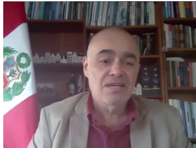
Gabriel Quijandría, ministro del Ambiente